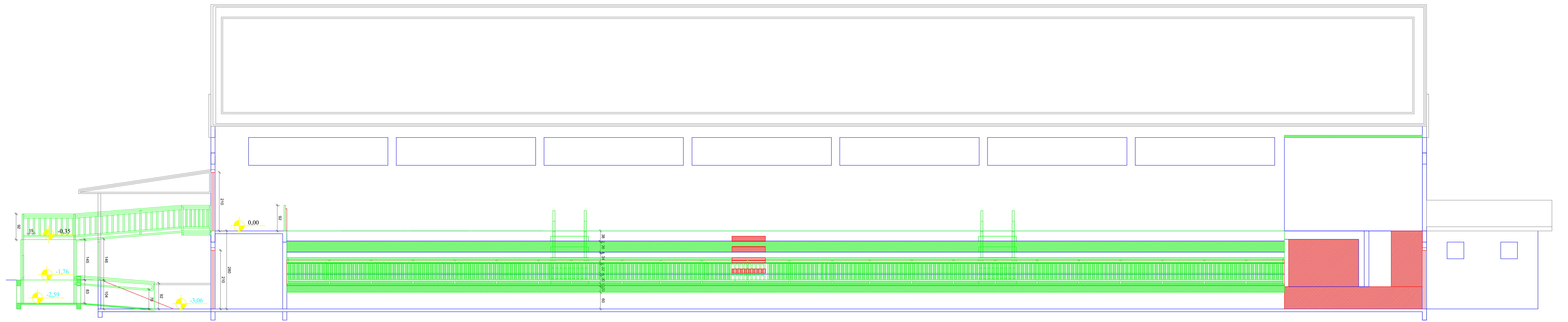
CORTE AA ESCALA 1:50