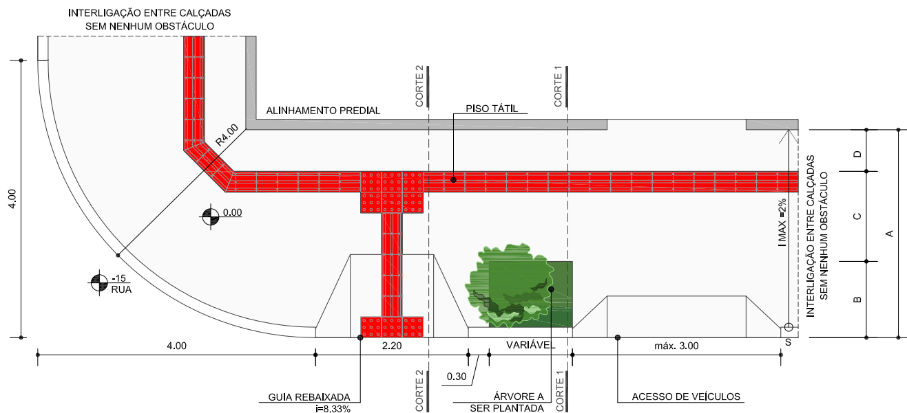
PLANTA DA CALÇADA ESCALA 1/75